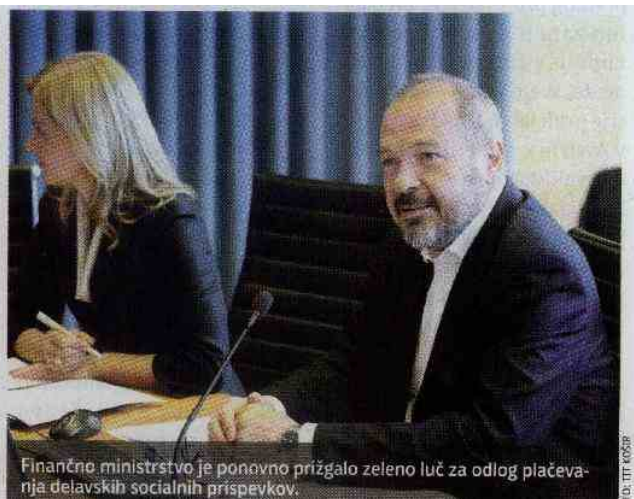
Finančno ministrstvo je ponovno prižgalo zeleno luč za odlog plačevanja delavskih socialnih prispevkov.