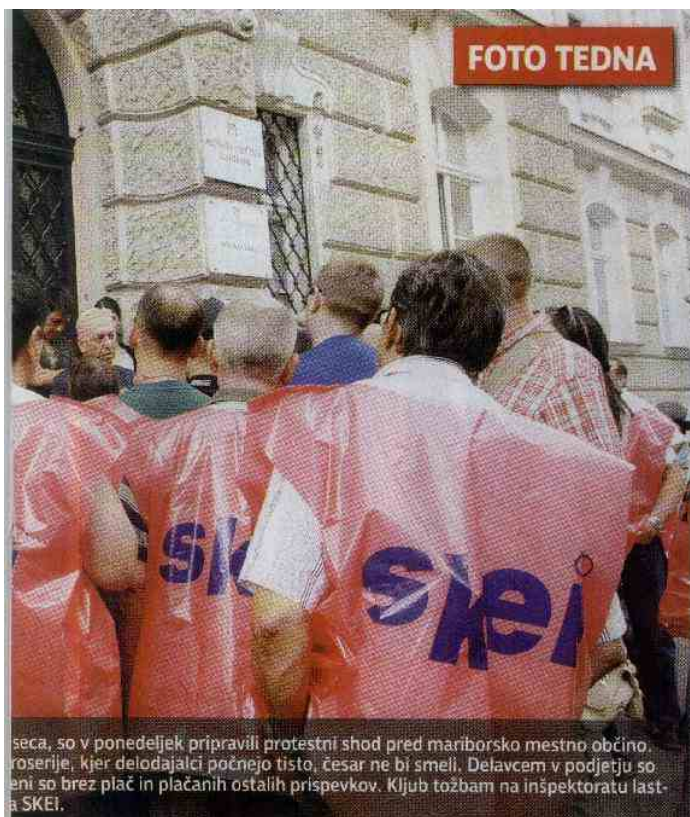
seca, so v ponedeljek pripravili protestni shod pred mariborsko mestno občino. roserije, kjer delodajalci počnejo tisto, česar ne bi smeli. Delavcem v podjetju so eni so brez plač in plačanih ostalih prispevkov. Kljub tožbam na inšpektoratu lasta SKEI.