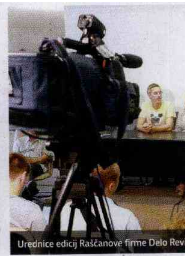
Urednice edicij Raščanove firme Delo Revij