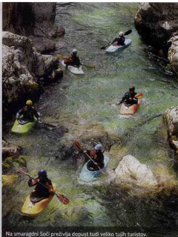
Na smaragdni Soči preživlja dopust tudi veliko tujih turistov.

da ne bi bili v neenakopravnem plačnem položaju. No, po živčnem tednu so stavko v Kopru v noči na soboto le zaključili. Izpad prihodka je ocenjen na dober milijon evrov, ker žerjavi niso delali, so nastajale zamude v tovornem prometu na železnici, jezili so se ladjarji, že so padale stave, v katero pristanišče bodo pobegnili, če bo koprsko stalo. Potem pa so pogajanja stavkajočih in luške uprave le dala rezultate. Člani stavkovnega odbora ne bodo