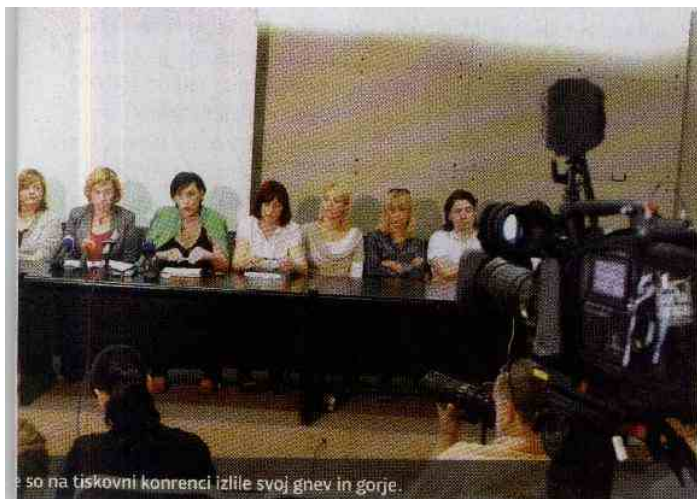
so na tiskovni konfrenki izlile svoj gnev in gorje.