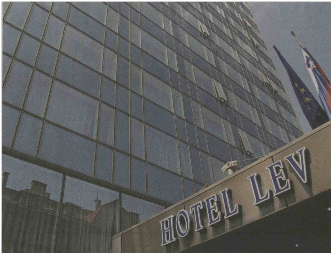
Iztisnitev malih delničarjev je korak k načrtovani pripojitvi Hotela Lev h GH Union.