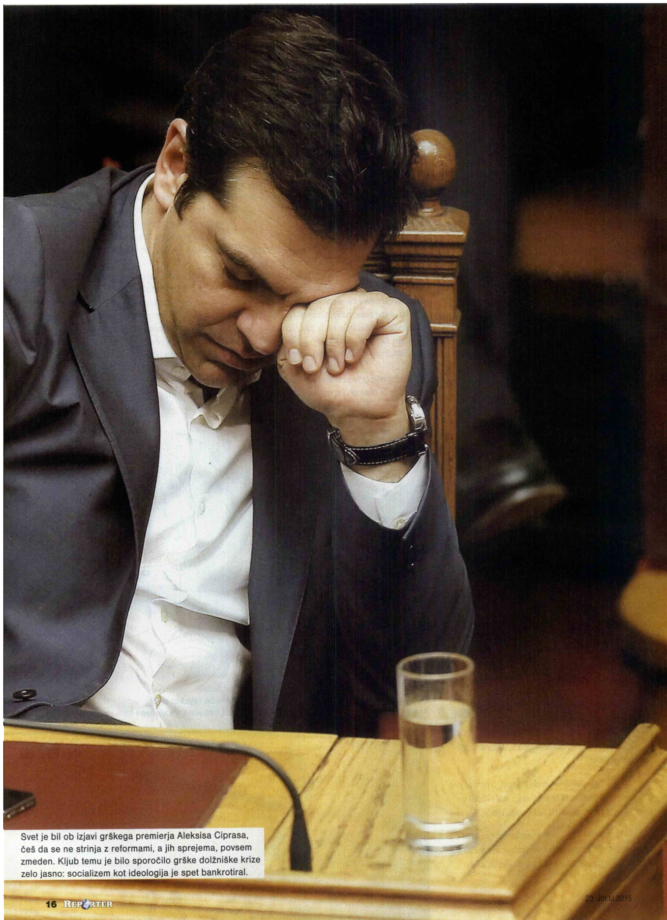
Svet je bil ob izjavi grškega premierja Aleksisa Ciprasa, češ da se ne strinja z reformami, a jih sprejema, povsem zmeden. Kljub temu je bilo sporočilo grške dolžniške krize zelo jasno: socializem kot ideologija je spet bankrotiral.