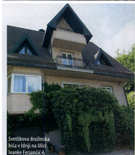
Svetlikova družinska hiša v Idriji na Ulici Ivanke Ferjančič 4.