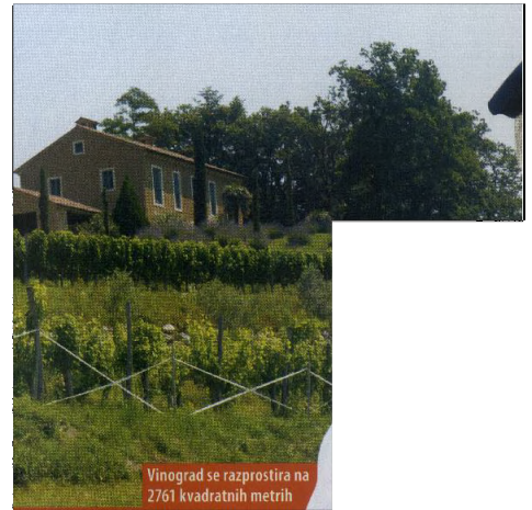
Vinograd se razprostira na 2761 kvadratnih metrih