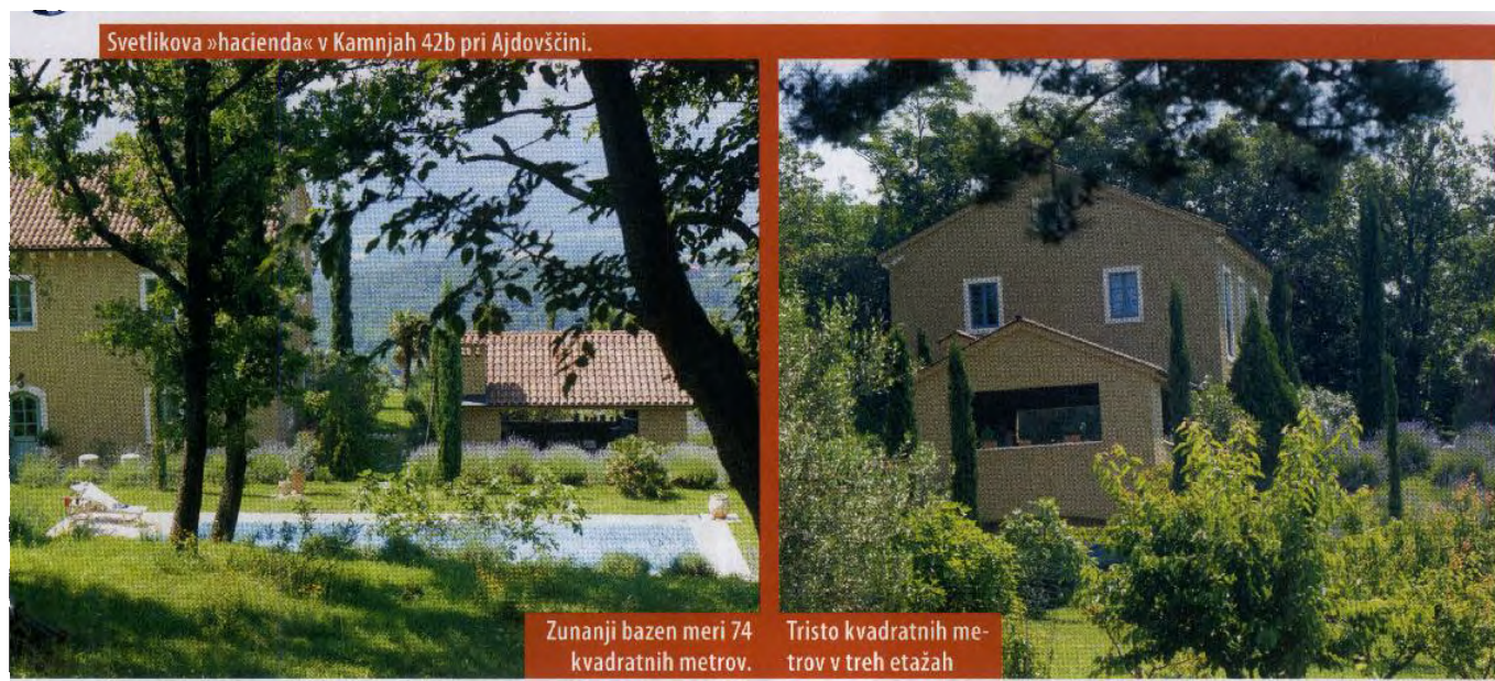
Svetlikova »hacienda« v Kamnjah 42b pri Ajdovščini.