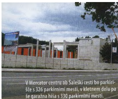
V Mercator centru ob Šaleški cesti bo parkirišče s 326 parkirnimi mesti, v kletnem delu pa še garažna hiša s 330 parkirnimi mesti.