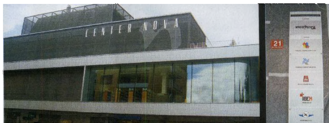
➤ Nekdanjo Namo je Tomaž Ročnik kupil za 319 milijonov tolarjev ter ~ nato občini prodal prvo nadstropje za 824 milijonov tolarjev.

odstranitvi malih delničarjev. Ti so prepričani, da pri izplačani odpravnini ni bilo upoštevano profitno in premoženjsko stanje družbe; že na podlagi javno objavljenih podatkov je možno ugotoviti, da je dejanska vrednot delnice družbe več kot 45 evrov.