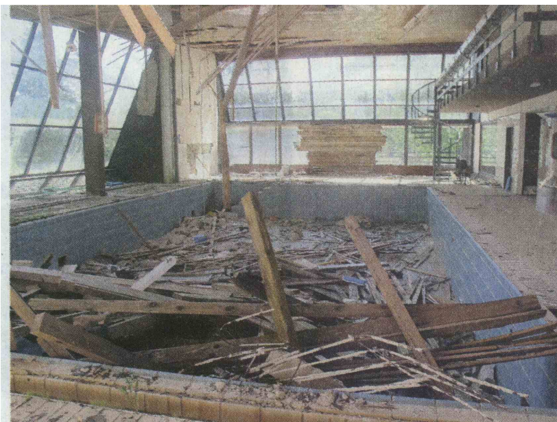
To je bil včasih bazen bohinjskega hotela Zlatorog.

Sledile so ovadbe, tožilci so jih po vrsti metali v predale: »Zakonska kršitev je bila storjena s prodajo lastninskih deležev takratnega Sklada za spodbujanje razvoja TNP, deleža Kapitalske družbe in Odškodninske družbe različnim podjetjem z is-