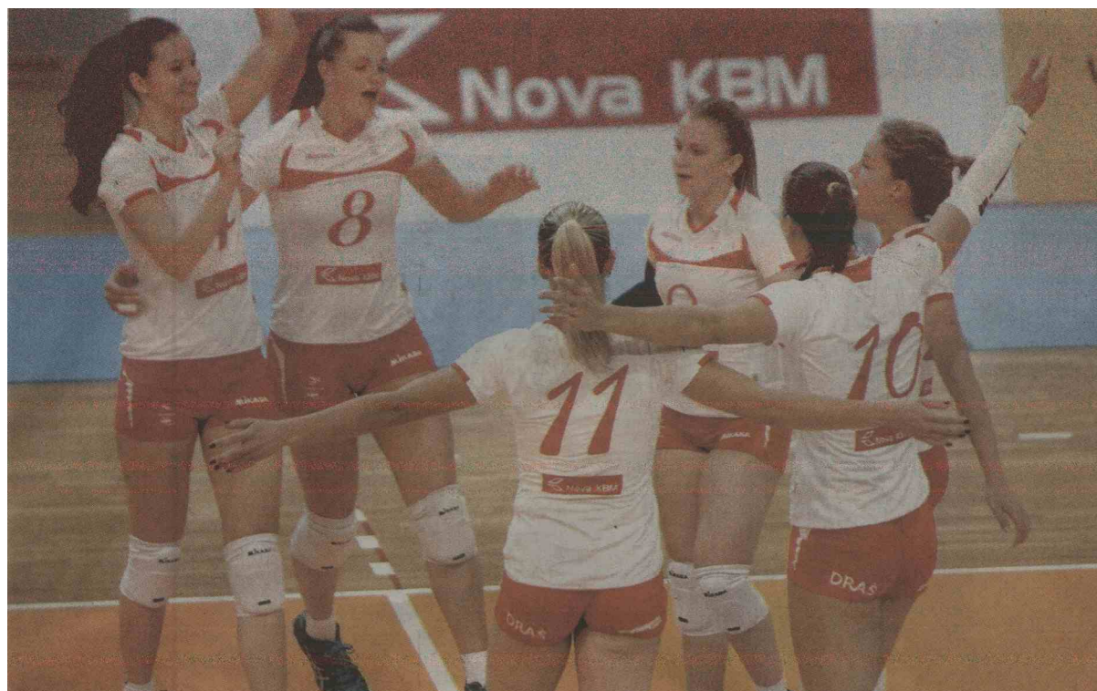
Kot sponzor je Nova KBM doslej večji del kolača namenjala športu. (Igor Napast)

A ker jim teče voda v grlo, pač prodajajo, ker so to ne glede na vse obljubili Evropski komisiji. Za nameček so si že v samem začetku zbili ceno, ko so daleč vnaprej natančno napovedali, katerih 15 podjetij bodo prodali, s to banko vred. Kaj takega počnejo le bedaki." (Jz)