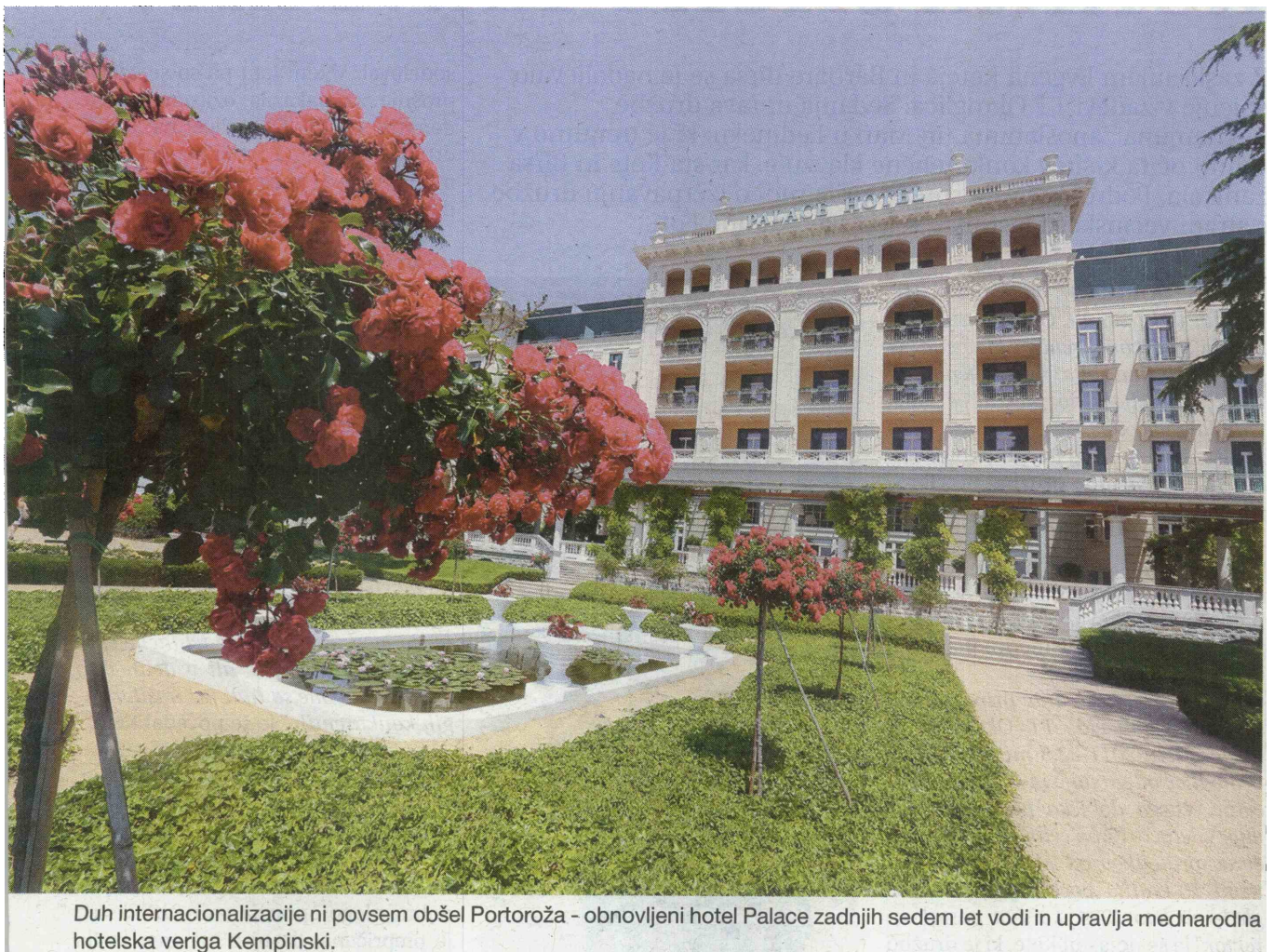
Duh internacionalizacije ni povsem obšel Portoroža - obnovljeni hotel Palace zadnjih sedem let vodi in upravlja mednarodna hotelska veriga Kempinski.