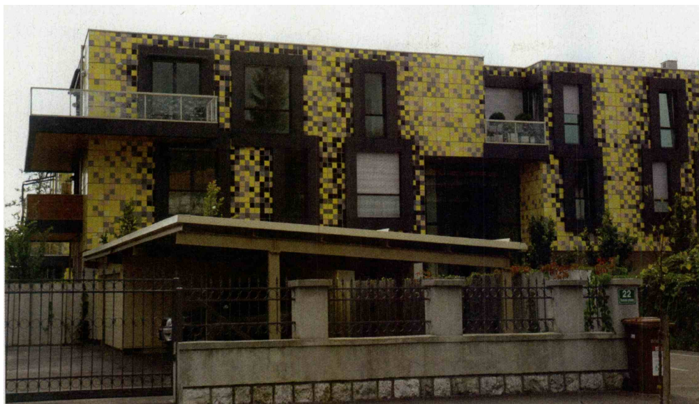
Prestizno stanovanje imata v stavbi, močeradu, v Trnovskem pristanu, vredno pa naj bi bilo več kot pol milijona evrov.

za tretjino več, kot je takrat znašala najvišja cena za stanovanje v središču Ljubljane. Investitor in izvajalec del je bilo novomeško gradbeno podjetje Begrad, kjer so takrat rekli, da so stanovanja kupili ljudje, ki več mesecev na leto preživijo v tujini in zato nimajo časa za vzdrževanje individualne hiše. Sosed zakoncev Pergar - Črešnar je bil Slobodan Subotić, košarkaški trener in nekdanji trener grškega prvoligaša Olympiacosa, a se je leta 2014 iz stanovanja izselil in ga prodajal za 650 tisoč evrov. Begrad, ki je danes v stečaju, je zemljišče v Trnovskem pristanu kupil od Aktive Investa, ta pa od Mizarstva Trnovo, ki je imelo tam svoje delavnice. Celotna izvedba hiše je stala kar 5,5 milijona evrov. D