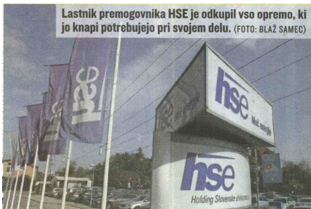
Lastnik premogovnika HSE je odkupil vso opremo, ki jo knapi potrebujejo pri svojem delu.

V skupini PV odgovarjajo, da se je premogovnik v letu 2014 zaradi zatisnitve izvažalne proge CD-1 soočal z velikimi likvidnostnimi težavami. S pomočjo Holdinga Slovenske elektrarne (HSE) mu je te težave uspelo prebroditi, v tem primeru ne gre za izčrpavanje, temveč pomoč. »Podatke, ki zadevajo medsebojne relacije med podjetji v skupini HSE, štejejo za poslovno skrivnost, zato jih ne moremo posredovati. V splošnem velja načelo, da vse, kar prodajamo ali dezinvestiramo, poteka na podlagi cenitev.« so zapisali. Glede koncesije pa: »Koncesija, ki jo ima PV, ni vezana na prodajo opreme, saj gre pri koncesiji za opravljanje dejavnosti izkopavanja premoga.«