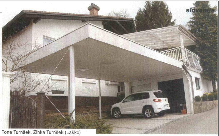
Tone Turnšek, Zinka Turnšek (Laško)