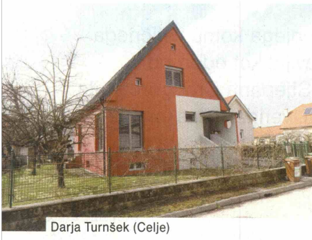
Darja Turnšek (Celje)