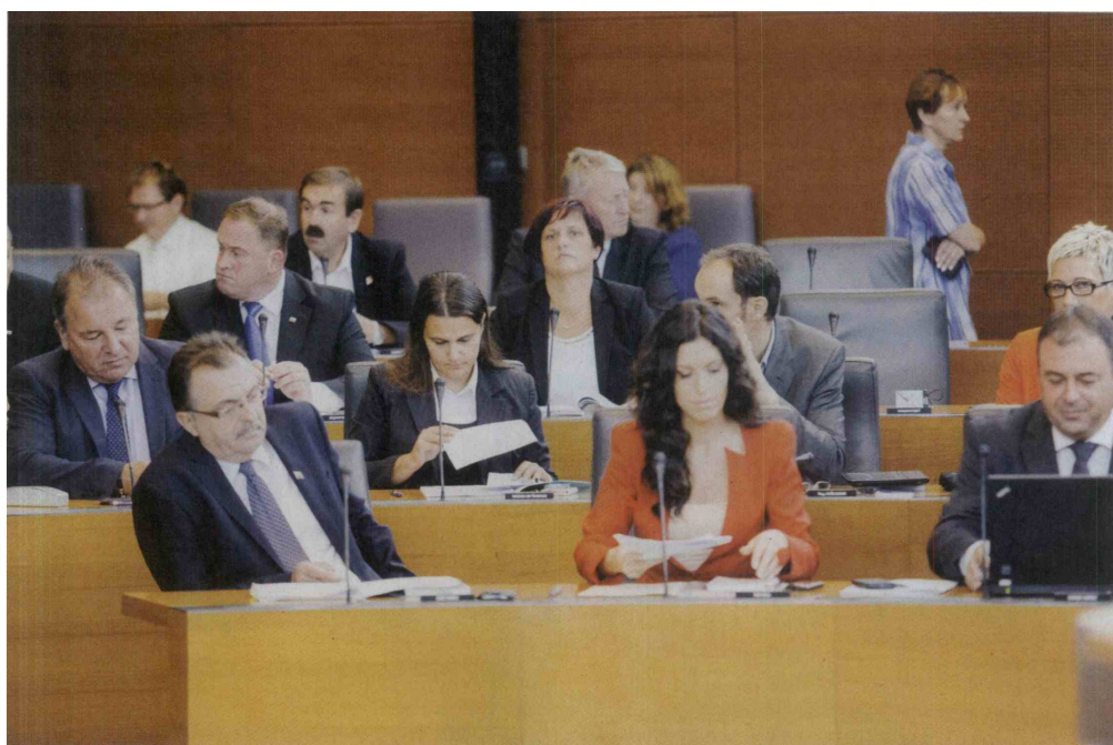
Poslanska skupina SDS je v parlamentarni razpravi o kandidatu za mandatarja razpravljala zelo dolgo in predvsem tehtno. Miro Cerar ji na koncu ni podal zadovoljivih odgovorov.

Konkretni in stvarni Janša V imenu SDS, ki bo v tem sklicu delovala v opoziciji, je mnenje poslanske skupine predstavil poslanec Janez Janša, ki je bil tudi dvakratni predsednik vlade in predsedujoči Svetu EU (edini iz Slovenije). Mandat pod Janševim vodstvom v obdobju 2004 do 2008 je bil najuspešnejši za državo, hkrati pa je bila takratna vlada tudi edina, ki je delovala celoten mandat. Janša je tako kot zelo kompetenten govorec in poznavalec razmer poudaril, da je Cerar predstavil program, »ki nič ne zavezuje in nič ne odvezuje«. Dejal je: »V predstavljenem programu nisem slišal niti ene številke in niti enega roka niti formule za čas, ki neizpodbitno prihaja. Razen če je konkreten program s številkami in z roki ter s pogajalsko taktiko zadaj z evropskimi institucijami, s katerim bo nova vlada pripravljena na srečanje z neizogibnimi izzivi, kje skrit.« Uvodoma je