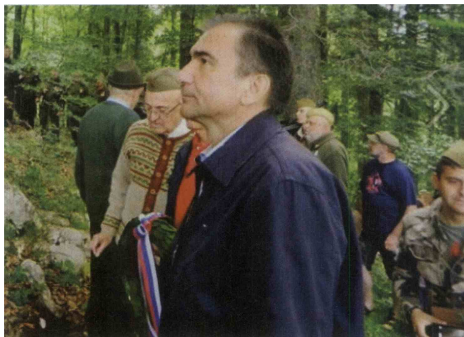
Janko Veber, nekdanji predsednik in zdaj podpredsednik DZ ter kandidat za obrambnega ministra, še julija 2013 v družbi »rdeče zvezde«.

je še nujnost reform, potrebo po spremembah in rešitvah ter spomnil na številne predloge zakonov, ki so jih pripravili v SDS ali vladah, ki jih je vodil, pa so jih v državnem zboru »od leta 2009 naprej v glavnem zavračali« ter si namesto iskanja rešitev raje