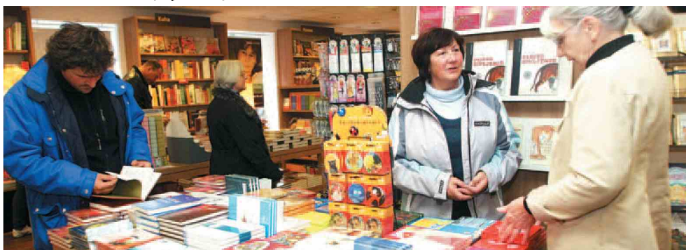
5. november 2009, odprtje Mestne knjigarne v Ulici 10. oktobra v Mariboru