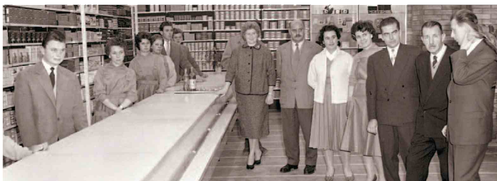
28. november 1959, odprtje nove poslovalnice MK v Jurčičevi ulici v Mariboru