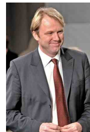
Gregor Golobič, nekdanji predsednik danes zunajparlamentarne stranke Zares