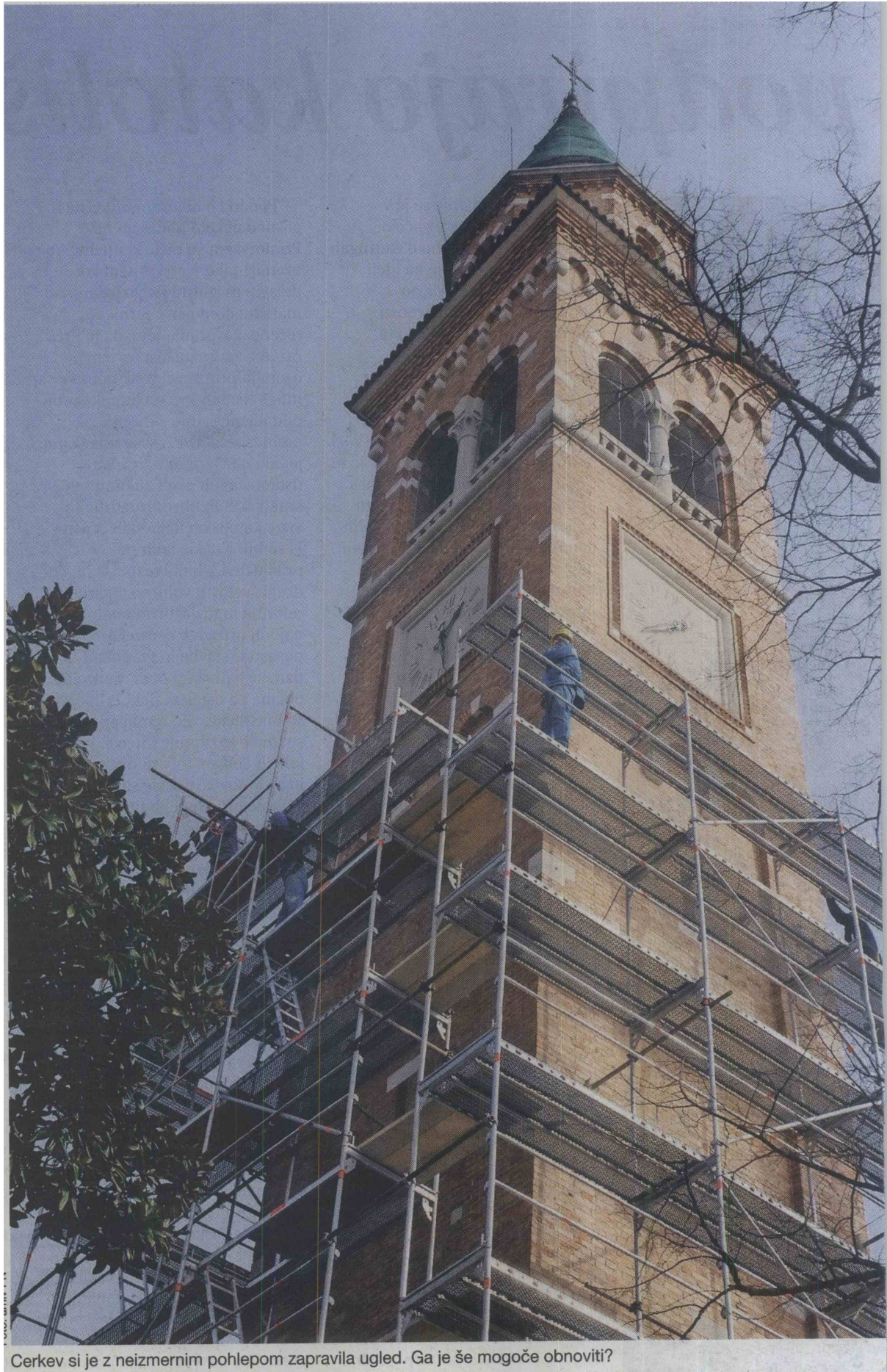
Cerkev si je z neizmernim pohlepom zapravila ugled. Ga je še mogoče obnoviti?