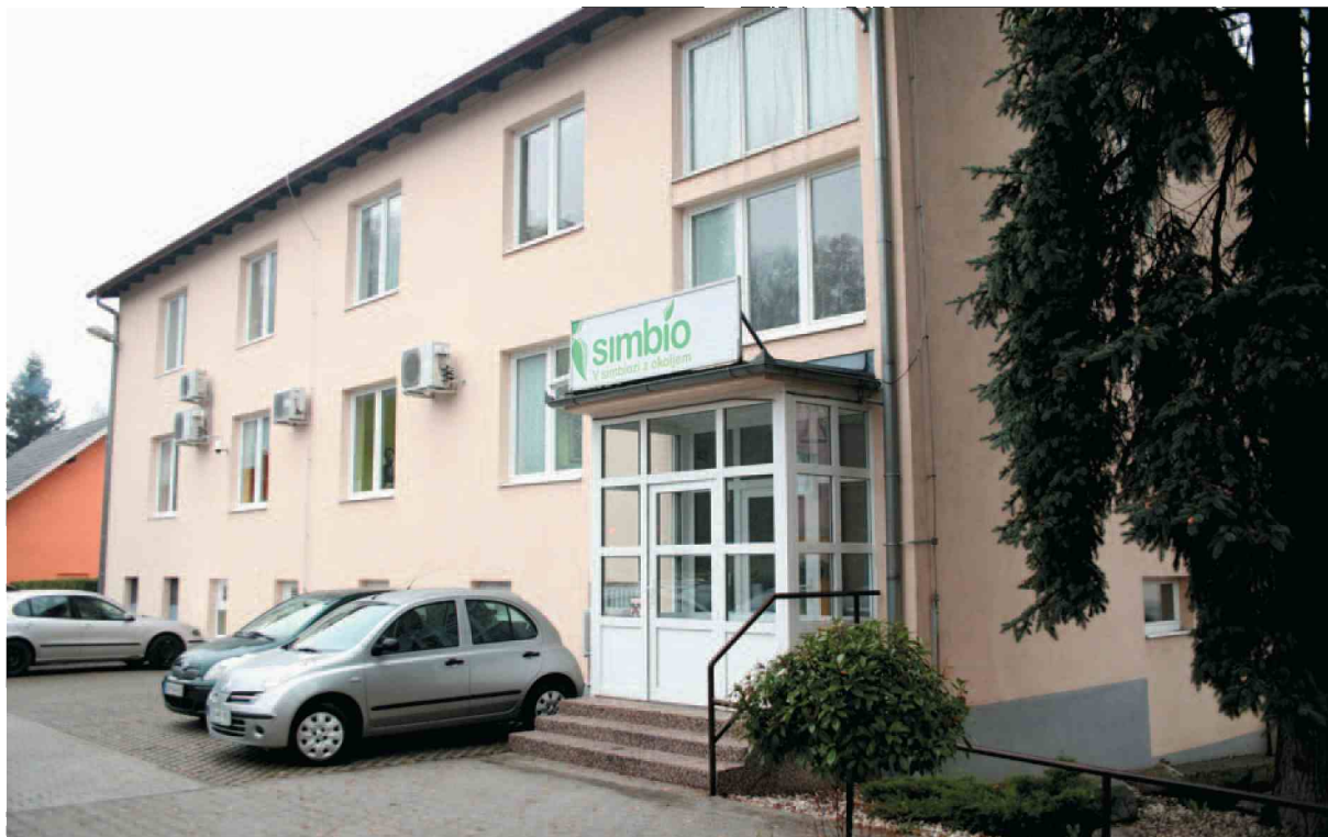
Predsednika nadzornikov HSE so preiskovalci poiskali kar na sedežu podjetja Simbio v Celju, katerega direktor je.