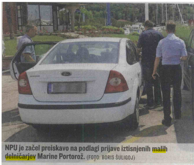
NPU je začel preiskavo na podlagi prijave iztisnjenih malih delničarjev Marine Portorož.

Majhenič je še povedal, da je bila izvedena še finančna preiskava, preiskovalci pa so vročili tudi sklepe za začasno zavarovanje protipravne premoženjske koristi v znesku 24,5 milijona evrov. Dodal je, da se zavarovanje nanaša na zavarovanje ene gospodarske družbe. Sicer pa je za kaznivi dejanji zlorabe položaja in oškodovanja upnikov predpisana zaporna kazen do osmih let. Predkazenski postopek usmerja specializirano državno tožilstvo. ■