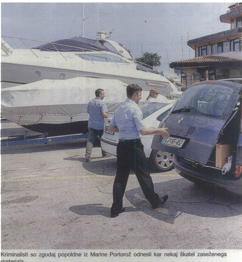
Kriminalisti so zgodaj popoldne iz Marine Portorož odnesli kar nekaj škatel zaseženega materiala