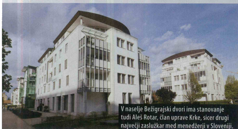
V naselje Bežigrasjski dvori ima stanovanje tudi Aleš Rotar, član uprave Krke, sicer drugi največji zaslužkar med menedžerji v Sloveniji.