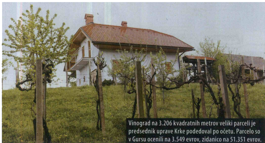
Vinograd na 3.206 kvadratnih metrov veliki parceli je predsednik uprave Krke podvedoval po očetu. Parcelo so v Gursu ocenili na 3.549 evrov, zidanico na 51.351 evrov.