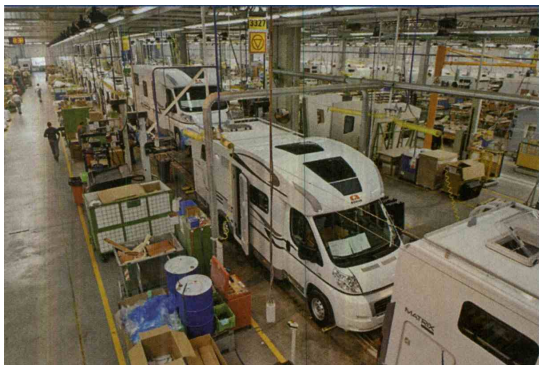
Adria Mobil iz Novega mesta ustvari večino dobička v holdingu ACH, ki se nato preliva v tajkunske žepne posameznikov.