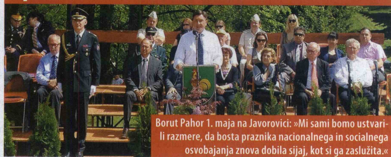
Borut Pahor 1. maja na Javorovici: »Mi sami bomo ustvarili razmere, da bosta praznika nacionalnega in socialnega osvobajanja znova dobila sijaj, kot si ga zaslužita.«

»Orgazmu zgodovine« se je v minulih dneh prepustil tudi predsednik republike Borut Pahor. »Socialna revolucija,« je dejal ob odlikovanju Partizanskega pevskega zbora Pinka Tomažiča, je »upoštevanja vredno za razlago političnega in narodnega razkola med drugo svetovno vojno in po njej, ni pa odločilno za vrednostno sodbo partizanstva kot domoljubnega gibanja in njegovega pomena za nacionalno