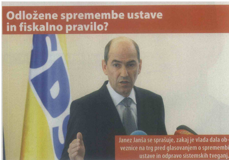
Janez Janša se sprašuje, zakaj je vlada dala obveznice na trg pred glasovanjem o spremembi ustave in odpravo sistemskih tveganj.