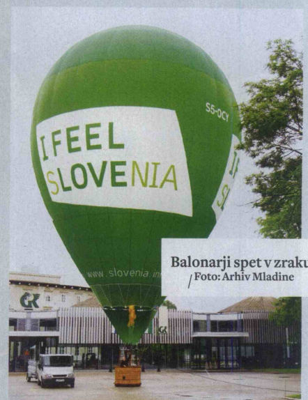
Balonarji spet v zraku