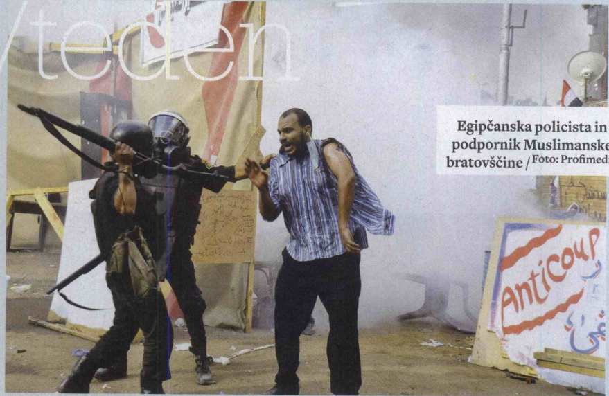
Egipčanska policista in podpornik Muslimanske bratovščine