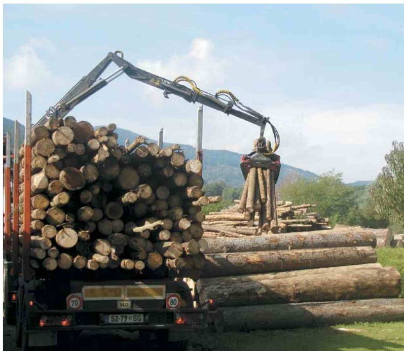
V lesnopredelovalni in gozdarski dejavnosti na Koroškem je ta čas zaposlenih le še okoli 600 ljudi. (Petra Lesjak Tušek)