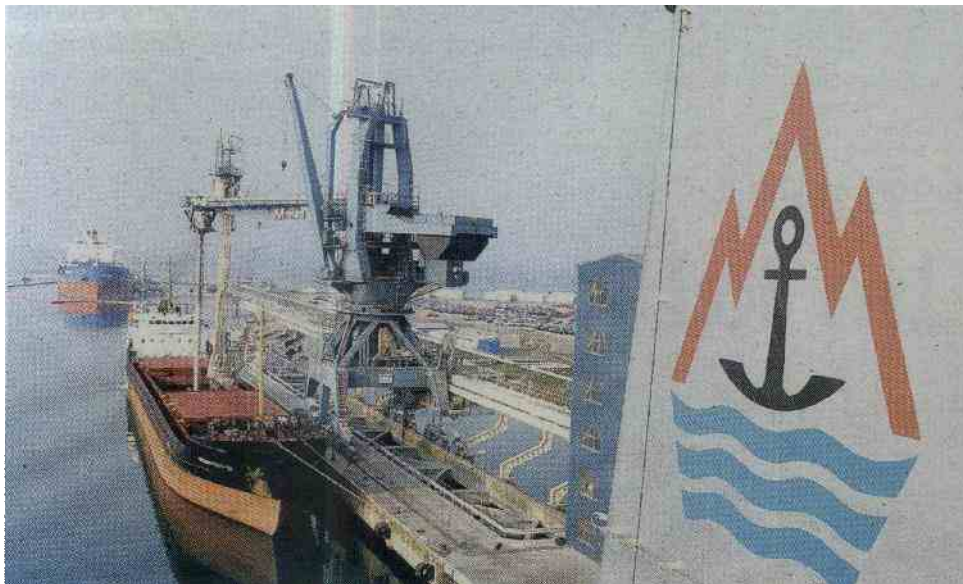
Koliko zanimanja bo vladalo za Splošno plovbo, bo znano sredi decembra. Družbo sicer lastniško z 51-odstotki obvladuje nemška družba Döhle