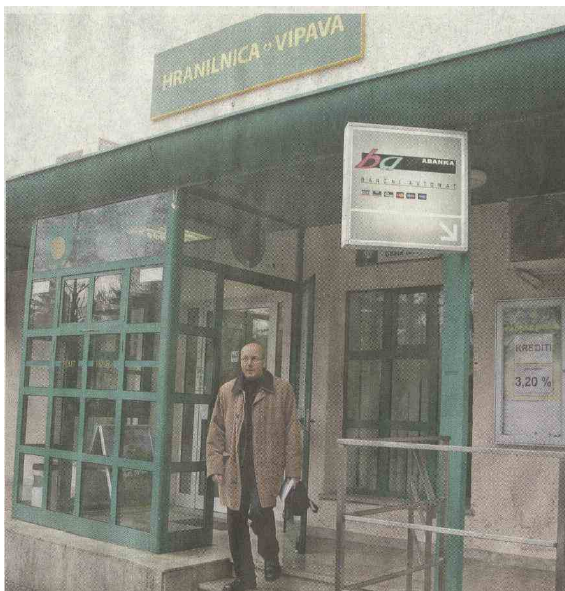
Mali delničarji in župani se bojijo likvidacije hranilnice.