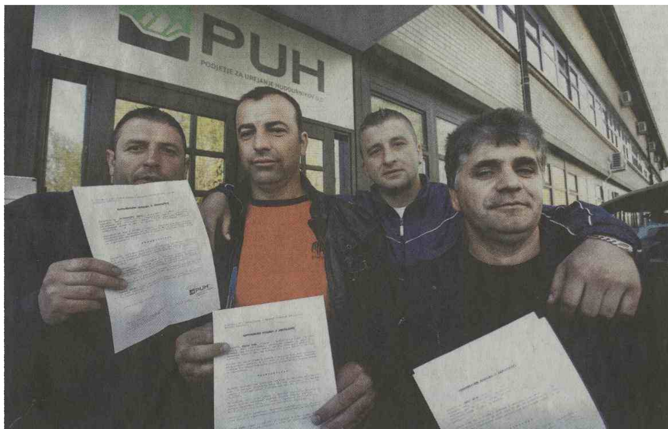
Okrog sedemdeset odstotkov delavcev podjetja prihaja iz BiH, nekaj je tudi delovnih invalidov.