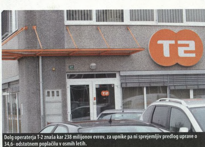
Dolg operaterja T-2 znaša kar 238 milijonov evrov, za upnike pa ni sprejemljiv predlog uprave o 34,6-odstotnem poplačilu v osmih letih.