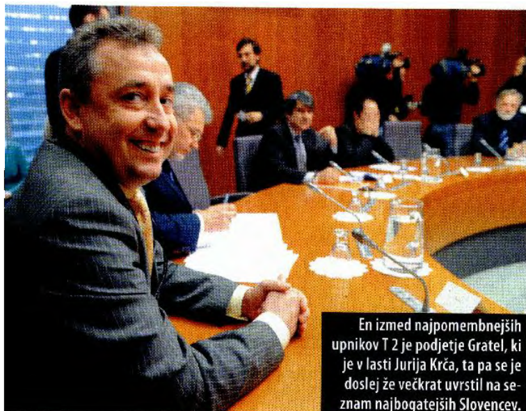
En izmed najpomembnejših upnikov T 2 je podjetje Gratel, ki je v lasti Jurija Krča, ta pa se je doslej že večkrat uvrstil na seznam najbogatejših Slovencev.