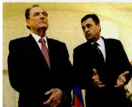
Po osamosvojitvi in zagonu avtocestnega križa je Zidar dobro sodeloval s tranzicijsko levico.