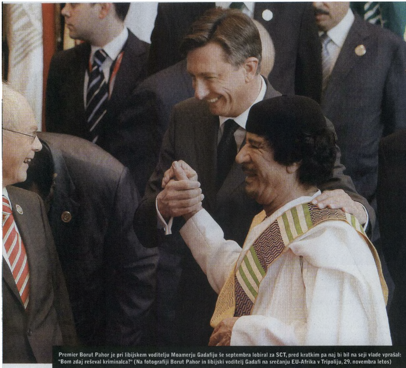
Premier Borut Pahor je pri libijskem voditelju Moamerju Gadafiju še septembra lobiral za SCT, pred kratkim pa naj bi bil na seji vlade vprašal: "Bom zdaj reševal kriminalca?" (Na fotografiji Borut Pahor in libijski voditelj Gadafi na srečanju EU-Afrika v Tripoliju, 29. novembra letos)