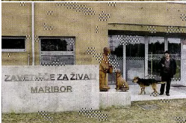
Mariborsko zavetišče za zapuščene živali na Teznerju