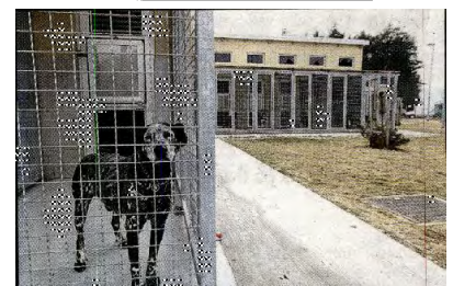
Kletke so postavljene tako, da psi ne lajajo drug na drugega.