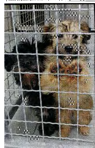
Iščeva novega lastnika.