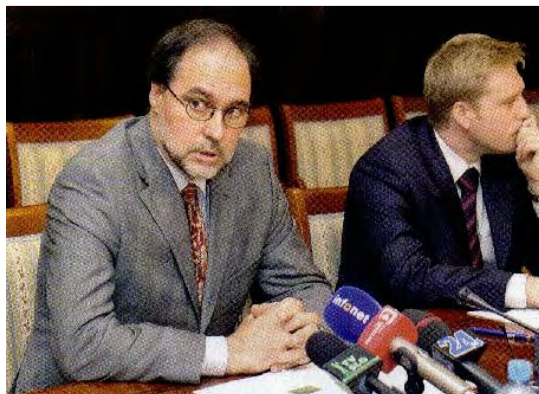
V času, ko je Banka Slovenije opustila potreben nadzor nad bankami v Sloveniji, je bil njen guverner Mitja Gaspari.

Opeharjeni davkoplachevalci Poleg tega, da imajo banke slabe