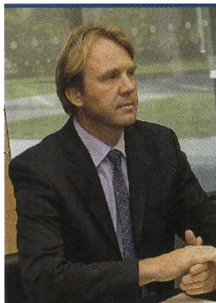
APEK sodi pod ministrstvo za visoko šolstvo, znanost in tehnologijo, ki ga vodi Gregor Golobič (Zares). Naključje?

nekdanje Jugoslavije za zaščito 'lika in dela' vladajočih?»