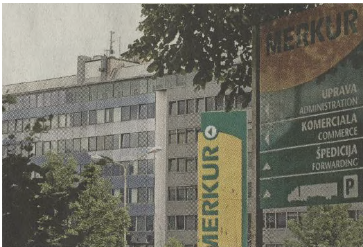
POSLOVNA STAVBA MERKURJA V NAKLEM