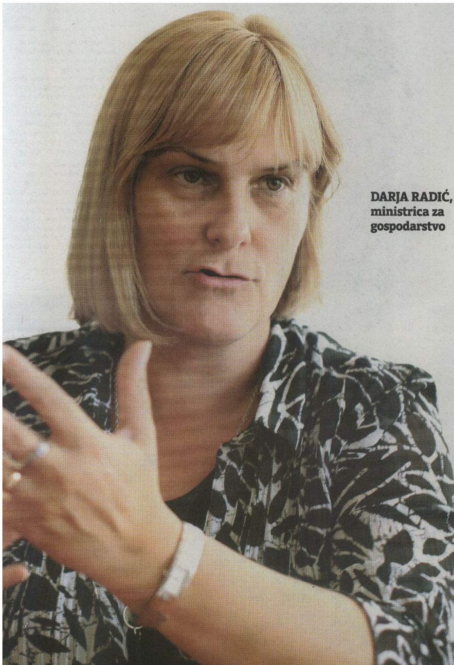
DARJA RADIĆ, ministrica za gospodarstvo