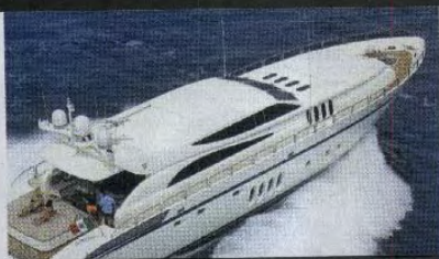
Tomaž Lovše, čigar premoženje je vredno 83,2 milijona evra, zna uživati v svojem bogastvu. Vozi se z ugledno jahto vrste leopard, v Slovenijo pa je pripeljal ameriške zvezdnike, pa čeprav le za eno noč.