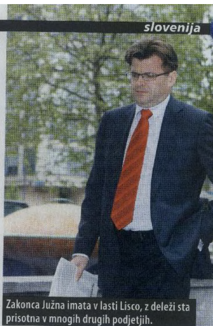
Zakonca Južna imata v lasti Lisco, z deleži sta prisotna v mnogih drugih podjetjih.