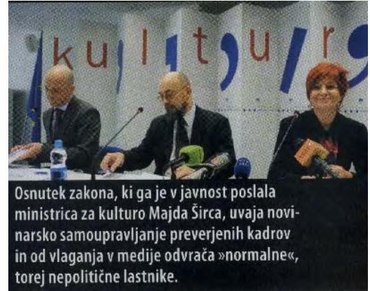
Osnutek zakona, ki ga je v javnost poslala ministrica za kulturo Majda Širca, uvaja novinarsko samoupravljanje preverjenih kadrov in od vlaganja v medije odvrča »normalne«, torej nepolitične lastnike.