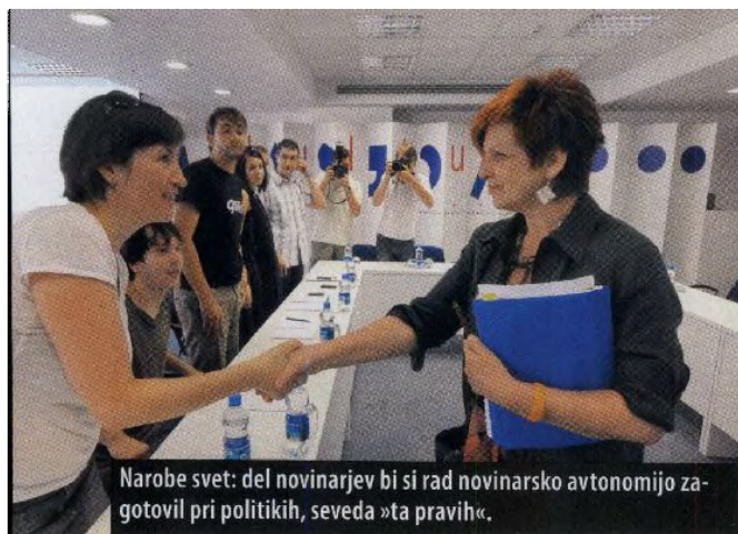
Narobe svet: del novinarjev bi si rad novinarsko avtonomijo zagotovil pri politikih, seveda »ta pravih«.