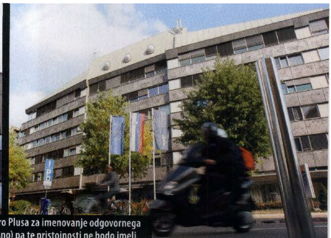
V skladu z absurdno predlagano novo zakonodajo bodo ameriški lastniki Pro Plusa za imenovanje odgovornega urednika POP TV potrebovali soglasje novinarjev, novinarji javne RTVS (desno) pa te pristojnosti ne bodo imeli.